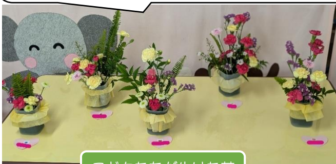
こどもたちが生けた花

5月はたくさんの「先生」（花文字、生け花、木工、だんごむし…）との出会いがありました。先生に見せてもらったり、教えてもらったりしたことを、自分たちでも試してみたり、繰り返し取り組んだりしました★